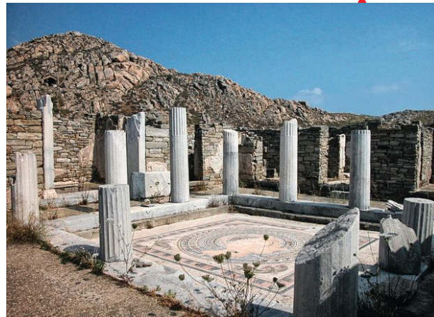
La maison des dauphins, Délos

Le site de Labraunda en Carie (Turquie) était fameux dès l'Antiquité pour avoir abrité l'un des sanctuaires les plus importants de la région, celui de Zeus Labraundos. Depuis 1948, le site a fait l'objet de fouilles qui ont mis au jour un site exceptionnel, particulièrement bien conservé au cœur des montagnes du Latmos. La période d'occupation la plus faste du site semble s'inscrire dans le courant du IV e siècle av. J.-C., sous le règne de la dynastie des Hékatomnides, nommés satrapes de la région carienne par le Grand Roi Perse. Labraunda joua un rôle central en devenant le pilier religieux de l'autorité politique des dynastes/satrapes cariens. Cette autorité s'exprima, à Labraunda notamment, par l'adoption d'une nouvelle culture matérielle qui tranchait nettement avec les anciens codes culturels cariens, tout en empruntant largement au monde grec voisin. L'objet de cette conférence est de présenter les contextes historique et archéologique de cette période à travers les travaux que nous menons à Labraunda, et de tenter d'éclaircir la démarche à la fois politique et culturelle des dynastes Hékatomnides.