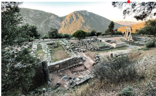
Delphes, Marmaria

La terrasse dite Marmaria à l'époque moderne a accueilli dans l'Antiquité plusieurs monuments et cultes importants pour la cité des Delphiens et pour les Grecs de toute la Méditerranée qui ont consulté le célèbre oracle panhellénique.