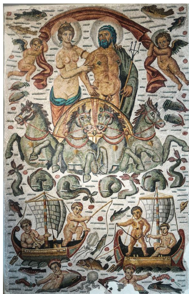
Mosaïque de Neptune et Amphitrite, 300 / 325 (1 er quart IV e siècle ap. J.-C.) découverte à Constantine (Cirta) en 1842

En 1830, la France , après la prise d'Alger, inaugure une longue séquence de colonie algérienne qui ne cessera que 132 ans plus tard. La science encore jeune de l'archéologie y tient une place très importante. Cette présentation propose de revenir dans les grandes lignes sur l'articulation entre conquête des territoires et création de nouveaux savoirs, tout en montrant comment des savoirs et comment les découvertes des sites antiques ont influé sur la patrimonialisation et les usages de l'Antiquité algérienne.