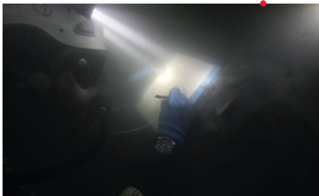
Constat d'état et expertise de l'épave AR14