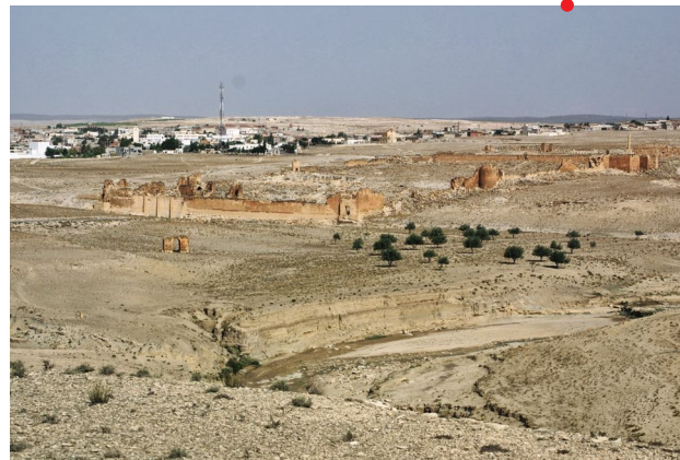
Vue d'ensemble d'Ammaedara et de la citadelle

Succédant au camp de la III e légion Auguste, la ville d'Ammaedara, dans la province romaine de Proconsulaire, se développe à partir des années 75 à la frontière actuelle entre la Tunisie et l'Algérie. C'est sa position stratégique à un carrefour de routes en bordure de la Dorsale tunisienne qui lui confère son importance. Les arpenteurs antiques la citent même en exemple de ville régulière, ce qui toutefois ne laisse pas d'étonner qui est allé sur place. Mais de fait, même si elle est surtout connue par son état tardif, Ammaedara est progressivement dotée de tous les monuments qui caractérisent une cité romaine. Les inscriptions, cependant, nombreuses, et tous les éléments du décor permettent d'observer que dans cette ville au climat rude, loin des côtes, la culture méditerranéenne est toujours bien présente.