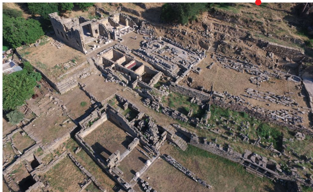
Vue de l'Andrôn A et de la terrasse du temple de Labraunda

Le site de Labraunda en Carie (Turquie) était fameux dès l'Antiquité pour avoir abrité l'un des sanctuaires les plus importants de la région, celui de Zeus Labraundos. Depuis 1948, le site a fait l'objet de fouilles qui ont mis au jour un site exceptionnel, particulièrement bien conservé au cœur des montagnes du Latmos. La période d'occupation la plus faste du site semble s'inscrire dans le courant du IV e siècle av. J.-C., sous le règne de la dynastie des Hékatomnides, nommés satrapes de la région carienne par le Grand Roi Perse. Labraunda joua un rôle central en devenant le pilier religieux de l'autorité politique des dynastes/satrapes cariens. Cette autorité s'exprima, à Labraunda notamment, par l'adoption d'une nouvelle culture matérielle qui tranchait nettement avec les anciens codes culturels cariens, tout en empruntant largement au monde grec voisin. L'objet de cette conférence est de présenter les contextes historique et archéologique de cette période à travers les travaux que nous menons à Labraunda, et de tenter d'éclaircir la démarche à la fois politique et culturelle des dynastes Hékatomnides.