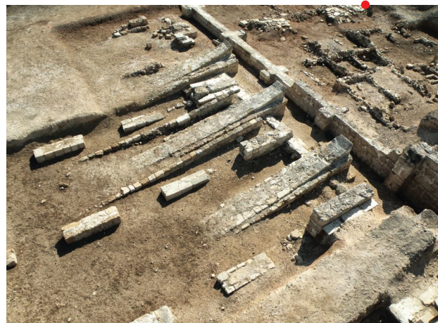
Les hangars à trières du port de guerre de Kition-Bamboula (IV e s. av. notre ère)

La reprise récente de l'étude de cette terrasse a pour objectif de réhabiliter les vestiges du sanctuaire d'Athéna Pronaia édifié à l'époque archaïque en contrebas du sanctuaire d'Apollon. Les recherches pluridisciplinaires commencées en 2017 sous l'égide de l'École française d'Athènes renouvellent nos connaissances sur ce site emblématique, dans une perspective à la fois historique et patrimoniale. Il s'agit de définir l'ancienneté de l'occupation et de comprendre la fonction de monuments désignés comme temples, trésors ou tholos. Un état des lieux de la documentation relative aux fouilles réalisées depuis 1901 et de nouvelles fouilles entamées en 2022 apporte des éclairages sur l'histoire de la terrasse, sur laquelle était honorée Athéna sous l'épiclèse de Pronaia (« devant le temple », sous-entendu « d'Apollon ») aux côtés d'autres divinités.